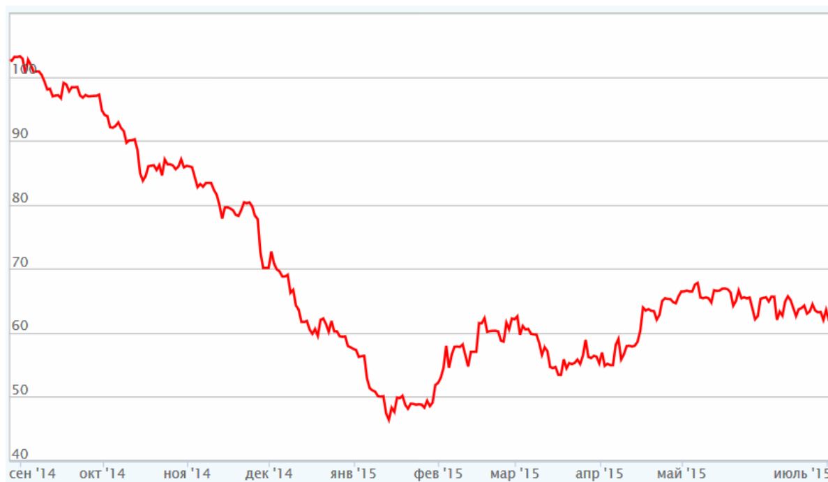
Рис. 3. Котировки нефти марки Brent (сентябрь 2014 г. – август 2015 г.)

Россией, в потребительском секторе – неоправданное завышение цен со стороны конечных ритейлеров.