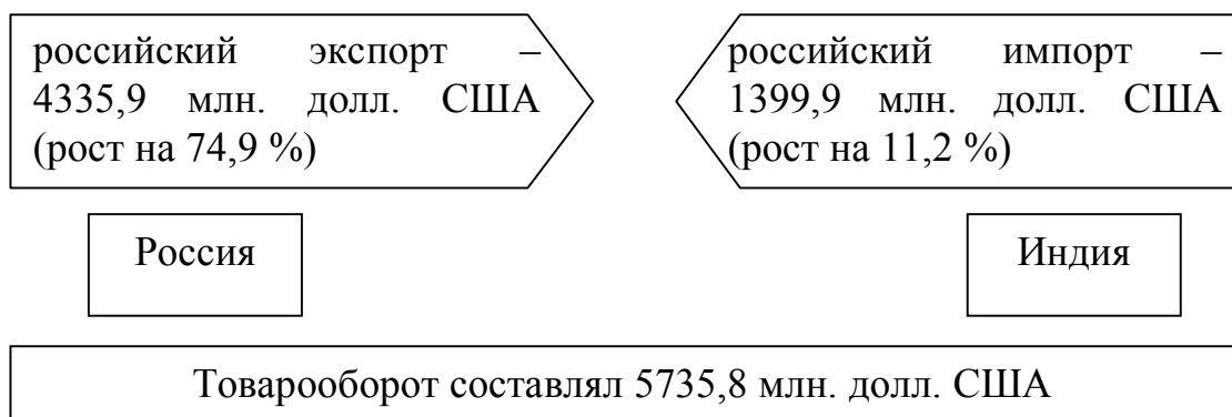
Рис. 1. Товарооборот между Россией и Индией

Наращивание торговых связей и взаимоотношений с государствами – стратегическими партнерами является одной из приоритетных задач России. Одним из таких партнеров является Индия. На сегодняшний день Индия демонстрирует стабильный рост ВВП. Товарооборот между Россией и Индией непрерывно растет. По данным Федеральной таможенной службы на начало 2012 года товарооборот составлял 5735,8 млн. долл. США, что превысило данный показатель по сравнению с аналогичным периодом прошлого года более чем на 50% (рисунок 1).