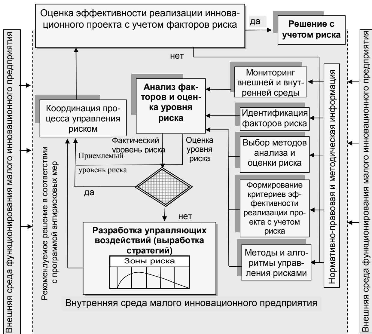
Рис. 2. Схема алгоритма управления риском инновационного проекта

5 Определение ожидаемых результатов при реализации инновационного проекта. Алгоритм управления риском инновационного проекта малого предприятия представлен на рисунке 2.