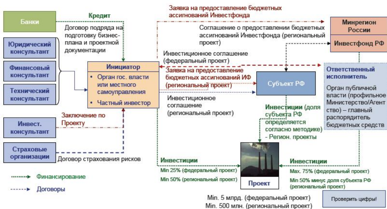
Рис. 2. Схема реализации проекта на основе института ГЧП

Взяв же за основу способы и источники финансирования объектов ГЧП схема реализации проекта развития промышленного предприятия с государственным участием на основе института ГЧП может иметь следующий вид (например, при финансировании за счет Инвестиционного фонда РФ) (см. рис.2).