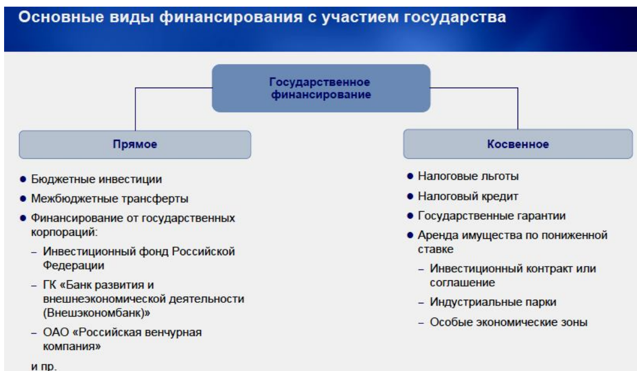
Рис. 3. Основные виды финансирования инвестиционных проектов с участием государства.

В большинстве случаев финансовые ресурсы, предназначенные для проектов на основе института ГЧП, мобилизуются одновременно по трем каналам: государственные (или муниципальные) бюджетные средства, активы частных акционеров и банковские займы. Источники бюджетного финансирования можно характеризовать представив основные виды финансирования инвестиционных проектов с участием государства на основе института ГЧП (см. рис. 3).