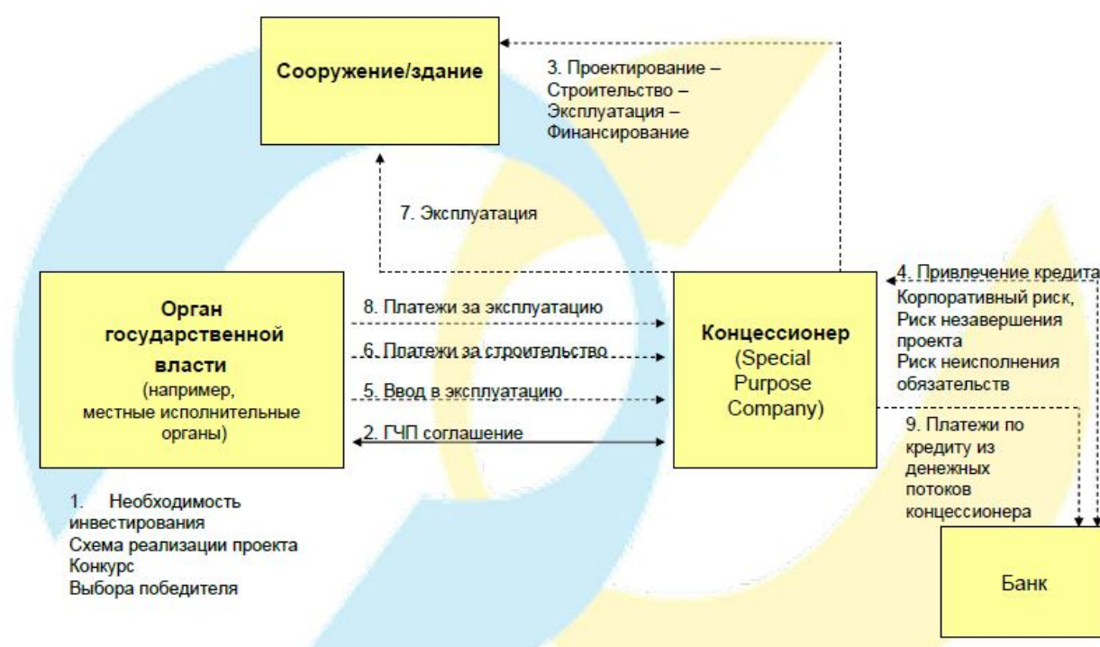
Рис. 5. Механизм проектного финансирования

- модель финансирования инвестиций позволяет уменьшить затраты на реализацию инвестиционного проекта благодаря возможности привлечения в состав инвестиционного капитала некоммерческих финансовых средств и включению в график финансирования очередных инвестиционных задач тех доходов, которые появляются после реализации определенных этапов (стадий, фаз) инвестиций, прежде чем они будут полностью завершены.